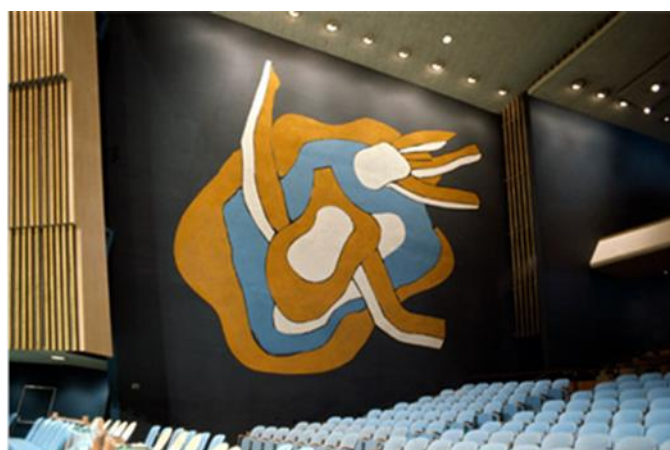
Mural de Fernand Léger en la Asamblea General de ONU